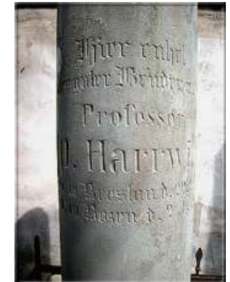
Grabstein im Friedhof von Bozen, wo Harrwitz seine letzte Ruhestätte fand.