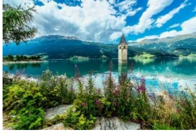
Resia Lake (Curon, Val Venosta)

An enchanting alpine region that captivates with its natural beauty and rich cultural tradition. Located in northern Italy, bordering Austria, Alto Adige is the perfect place for an unforgettable vacation.