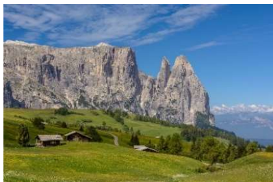
Seis am Schlern (Kastelruth)

Tauchen Sie ein in die atemberaubende Schönheit der Alpen: majestätische Berge, grüne Täler, kristallklare Seen und bezaubernde Wälder.