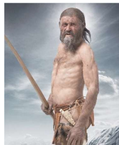
Ötzi, l'uomo venuto dal ghiaccio, esposto al Museo archeologico

creando un ambiente unico. Esplora affascinanti cittadine medievali, castelli storici e musei. Il museo archeologico di Bolzano, a soli 50 metri dalla sede di gioco, ospita "Ötzi" conservato nel ghiacciaio per oltre 5000 anni è la più antica mummia conosciuta.