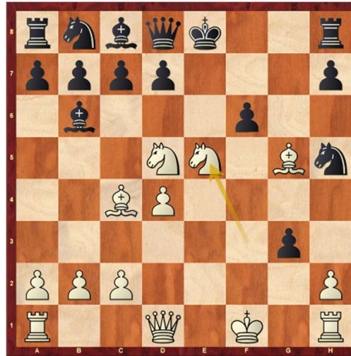
Stellung nach 13.Se5!

1.e4 e5 2.f4 exf4 3.Lc4 Dh4+ 4.Kf1 Lc5 5.d4 Lb6 6.Sf3 De7 7.Sc3 Sf6 8. e5 Sh5 9.Sd5 Dd8 10.g4 fxg3 11.Lg5 f6