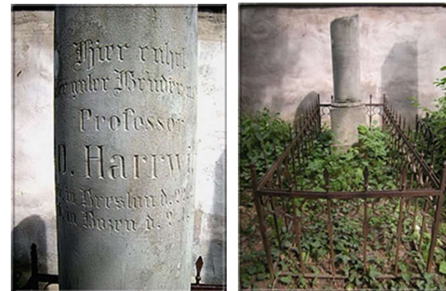
Grave of Daniel Harrwitz in the Bolzano cemetery