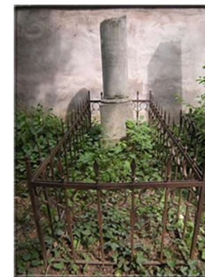
Immagine della tomba di Harrwitz nel cimitero di Bolzano

Gries, un quartiere di Bolzano, all'epoca era una località termale con un sanatorio di fama mondiale. Poiché Harrwitz soffriva di una malattia polmonare, che è anche indicata come causa della sua morte, si è ipotizzato che potesse essere sepolto lì. Alla fine, però, D'Ambrosio è riuscito a trovare la sua lapide nel cimitero ebraico di Bolzano.