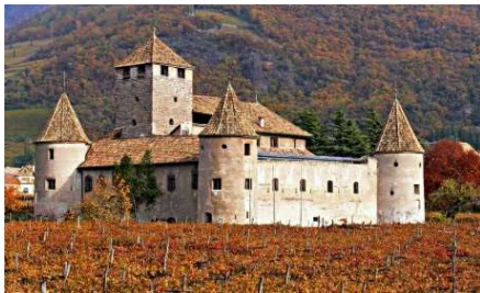
Mareccio Castle (Bolzano)

South Tyrol is a fascinating fusion of cultures. Here, Alpine traditions