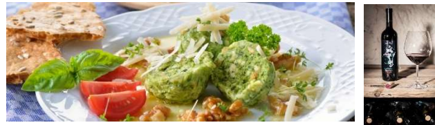
Spinach-Knödel, traditional "Schüttelbrot" and Lagrein wine

Delight your palate with the extraordinary cuisine of Alto Adige. Taste the authentic flavors of traditional dishes such as speck, "Knödel", local cheeses, and Tyrolean desserts. Accompany