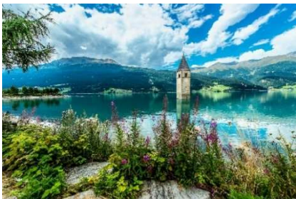
Lago di Resia (Curon, Val Venosta)

Situata nel nord Italia, al confine con l'Austria, l'Alto Adige è il luogo ideale per una vacanza indimenticabile.