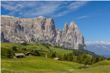
Siusi allo Sciliar (Castelrotto)

Immerse yourself in the breathtaking beauty of the Alps: majestic mountains, green valleys, crystal-clear lakes, and