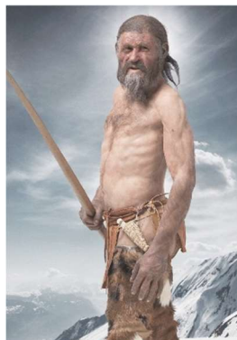
Ötzi, der Mann aus dem Eis, Ausstellung im Archäologiemuseum

Schlösser und Museen. Das archäologische Museum von Bozen, nur 50 Meter vom Veranstaltungsort entfernt, beherbergt „Ötzi“, die älteste bekannte Mumie, die seit über 5000 Jahren im Gletscher konserviert wurde.