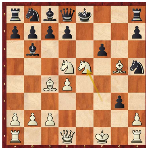
posizione dopo 13. Ce5!

1.e4 e5 2.f4 exf4 3.Ac4 Dh4+ 4.Rf1 Ac5 5.d4 Ab6 6.Cf3 De7 7.Cc3 Cf6 8. e5 Ch5 9.Cd5 Dd8 10.g4 ffg3 11.Ag5 f6