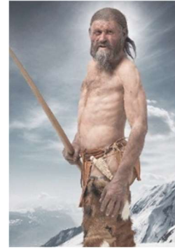
Ötzi, the Iceman, Museum of Archeology in Bolzano

environment. Explore charming medieval towns, historic castles, and museums. The archaeological museum of Bolzano, just 50 meters from the playing venue, houses "Ötzi," preserved in the glacier for over 5000 years, making it the oldest known mummy.